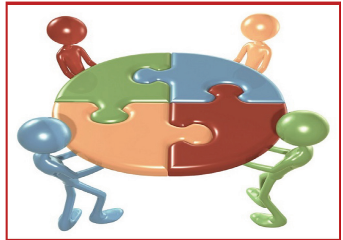
الشكل 2: التشارك في التعلم الجماعي