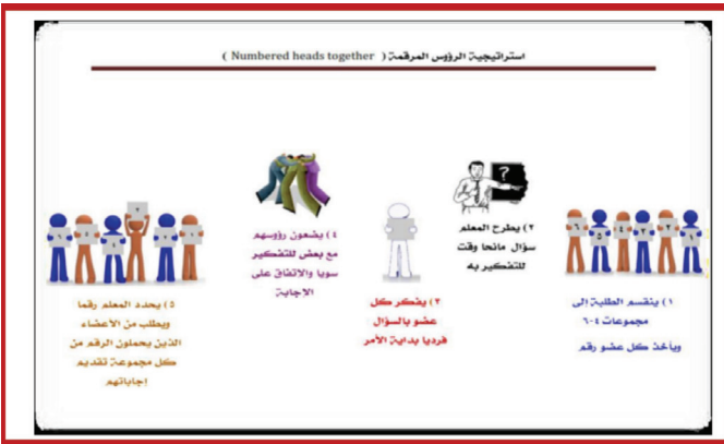
الشكل 3. استراتيجية الرؤوس المرقمة