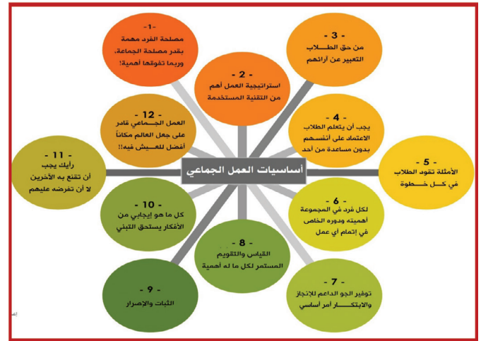
الشكل 1. أساسيات العمل الجماعي