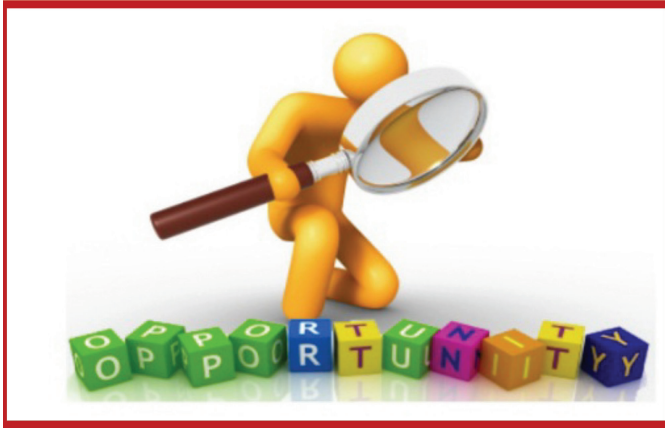
الشكل 6. استراتيجية التعلم بالاكشاف

ويتم في هذه الاستراتيجية طرح التساؤلات التي تساعد في اعداد المواد التعليمية، وكذلك أسئلة فرعية والتجارب التي يمكن تنفيذها لاكتشاف حلول لبعض المشاكل لتعليم الطالب كيفية اختبار ما اكتسبه في الواقع. 25