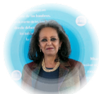
Е.П. г-жа Сахле-Ворк Зевде Председатель Международной комиссии