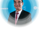
Джастин Ифу Линь