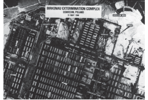
آشوٹز برکیناؤ جرمن نازی حراستی تے قتل گاہ کیمپ 1979ء اچ یونیسکو دے عالمی ثقافتی ورثہ دی فہرست تے لکھیا گیا سی

نسل پرستی تے مبنی پروپیگنڈا نوں پھیلان لئی روانڈا اچ ٹٹسی دی نسل کشی اچ ریڈیوز دا استعمال تے قاتلاں نوں مظلوماں دی نشاندہی کرنا وی ایس نوں درست طور تے واضح کرا اے۔ ٹیکنالوجی دی طاقت دا ایہوجیا شعور طالب علماں نوں اچ دے دور دے انسانی حقوق دے مسائل دا معائنہ کرن اچ مدد دے سکا اے، جیہڑا جواب اچ ایہوجی خلاف ورزیاں نوں روکن لئی سیاسی کاروائی تائیں لے جا سکا اے۔ گزشتہ ورہیاں دے دوران ٹیکنالوجی دے میدان اچ ایہوجی اہم تبدیلیاں ویکھدیاں ہوئے ایہہ ضروری اے۔