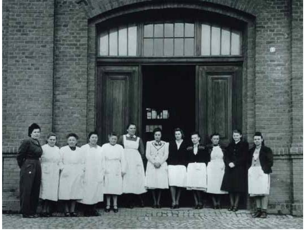
پہڑا مار "یوتھو نیسیا" مرکز، جرمنی اچ نرسنگ دا عملہ