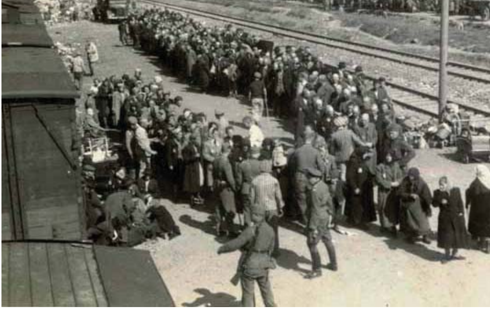
برکیناؤ، پولینڈ. پلیٹ فارم تے اک انتخاب، 27/05/1944

“جے بربریت ساڈی تہذیب اچ شامل اے، تے تعلیمی کوششاں دا مقصد بربریت دے لئے اس دی صلاحیت نوں سمزے لیاؤنا اے۔”