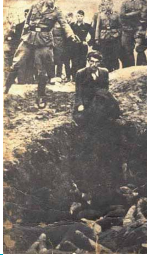
وٹنز (Vinnitza), یوکرائن، جرمنی دے فوجی اک آئن سیٹزگروپن (Einsatzgruppen) فوجی ولوں اک بہودی دا قتل ہونڈیاں ویکھ رنیے نیں، جولائی 1941

حملہ اچ تے بہودی آبادی دی تقریباً تباہی اچ، نہ صرف کہ جرمنی بلکہ زیادہ تر یورپ اچ ریاست، کلے فرد تے معاشریاں اچ مجموعی حیثیت نال، ودھدیاں بوئیاں انسانی حقوق دیاں خلاف ورزیاں پاروں شعور اچ وادھا کرے گا۔ نازی جرمنی دے جیوین سدیا جاندا اے "آپریشن T4" رحمدلانہ قتل پروگرام اچ جرمنی دے ڈاکٹراں تے نرساں دے کماں دا اک معائنہ (جیس دے دوران 200,000 توں ودھ ذہنی یا جسمانی معذور لوکاں، عورتاں تے چھ سال توں وڈے بالال دے قتل دا کارن بنیا) اک ہور مثال اے۔ ایسی طرح، یورپ دے پوربی حصیاں اچ آئن سیٹزگروپن (خصوصی قاتل اسکواڈ) دے کام دے حصہ دے طور تے ریگولر جرمنی دے فوجیاں دی دس لاکھ یہودیاں دے قتل اچ شمولیت انسانی رویے، مطابقت تے نظریات دی طاقت لئی پوچھ گچھ دے ول لے جاندا اے، مختصر ایہہ کہ، سرکاری ذمہ داری اچ کیتے گئے افعال جیہڑے بین الاقوامی تسلیم کیتے گئے انسانی حقوق دی خلاف ورزی سن اچ قانون لئی سوسائٹی دی وابستگی۔ ہولوکاسٹ دے بارے اچ تعلیم دینا جواناں نوں اوہ نظریات سمجھن اچ مدد کر سکدا اے جیہڑے مفید ثابت ہو سکدے نیں جدوں اجتماعی قتل عام دیاں دوجیاں مثالیں تے غور کریے۔ جدوں شاگرد دوجے وڈے پیمانے تے انسانی حقوق دی خلاف ورزیاں دی تاریخ پڑھدے نیں، تے اوہ ہولوکاسٹ بارے اچ اپنی سمجھ ورتن دے قابل ہون گے تے عالمی شہریاں تے طور تے آپی ذمہ داریاں سمجھن دے ہور قابل ہون گے۔