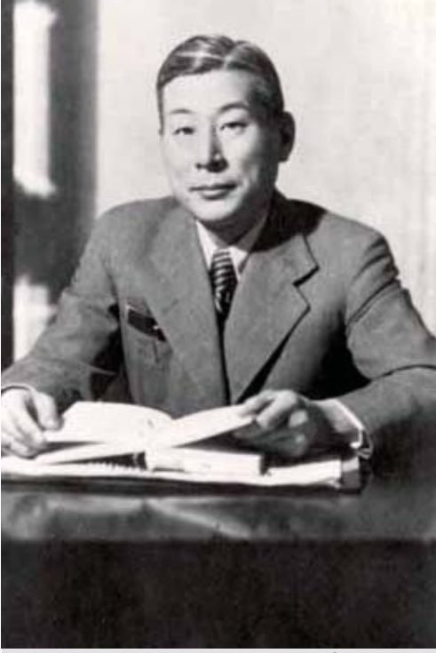
چیون سیمپو سوگیہارا (ChiuneSempo Sugihara)، کونو اچ، جاپان دے فونصل جنرل، نے 2,000 توں ودھ ویزے جاری کیتے، انج یہودیوں پناہ گزیناں نوں یورپ توں فرار ہون اچ مدد کیتی۔

جدوں سرکار دوجیاں لئی وحشیانہ اقدامات کر رئی ہووے تے کجھ نہ کرنا سازش اچ ای شریک جرم ہونڈ دی اک شکل اے، جیڑا ہولوکاسٹ دی صورت اچ، شریک کاراں دے کم نوں ہور ودھ کے وسیبی طور تے قابل برداشت بنا دتا سی۔