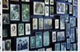
زیتوشوا - بے بنک جو ہیزویم ٹیشا ویکرہ شہ نامی دی اریووستی

دے لئی پالیسیاں اتے دینی چاہیدی۔ اونہاں دا ساخت دے لحاظ نال موازنہ تقابلی نسل کشی دے پڑھائی دی بنیاد اے۔ لیکن کوئی وی ایہہ فرض نئی کر سکدا اے کہ ہولوکاسٹ دے مظلوماں دے مصائب کسی ہور گروپ دے مصائب توں بدتر سن جیہڑے کسی ہور نسل کشی دے واقعے اچ مارے گئے سن، نہ ای نسلان مکان دے کسی وی تنظیمی ڈھانچہ تے زور دتا جانا چاہیدا۔ وڈے پیمانے تے تشدد دی ہر مثال، بشمول ہولوکاسٹ نوں ایس دی آپرے لحاظ نال سمجھیا جانا چاہیدا، نہ ای اینوں گھٹ