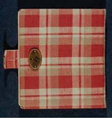
این فرینک (Anne Frank) دی پہلی ڈائری۔ این فرینک دی ڈائری یونیسکو دی ایس جگ دیاں یاداں اچ شامل کیتی گئیں سن۔ 2009 اچ رجسٹر شدہ

بہت سارے معلمان نے نصابی پار طریقہ نوں تعلیم دین لئی نہایت ای مفید پایا اے۔ درست تاریخی، ادبی، فنی، تے موسیقی دے مواد دا اکٹھ کرنا تے ورتنا طالب علماں نوں اک تناظر اچ سیکھے ہوئے علم نوں ورتن لئی اک بامعنی طریقہ تے دوجے تناظر اچ اک علم دی بنیاد فراہم کردا اے۔ مثال دے طور تے، اشووتز دے تاریخی پڑھائی نال، جے طالب علم پرائمو لیوی دی شارٹ اسٹوری Lilit e altracconti پڑھن، تے اوہ اونہاں نوں اک زیادہ بامعنی تناظر اچ رکھن دے قابل ہون گے۔