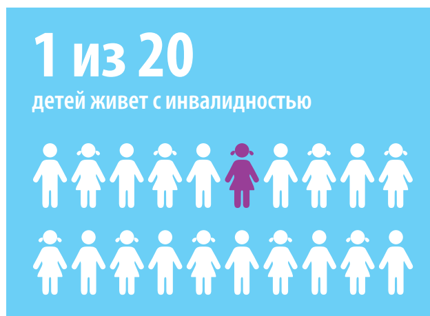
Рис. 2. Число детей с инвалидностью

Источник данных: Всемирная Организация Здравоохранения (2011). 3