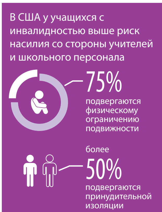
Рис 5. У учащихся с инвалидностью выше риск буллинга со стороны учителей

К учащимся с инвалидностью чаще применяют физические средства ограничения подвижности, их чаще изолируют, запирая в помещении. Исследования в США показали, что в целом инвалидность имеет каждый десятый учащийся, однако ученики с инвалидностью составляют три четверти тех, к кому применяют физические средства ограничения подвижности, и более половины тех, кого школьный персонал насильно удерживает в закрытых помещениях. Учащиеся с эмоциональной и интеллектуальной формами инвалидности чаще всего подвергаются физическим мерам ограничения подвижности или изоляции в закрытом помещении (Рис. 5). 28