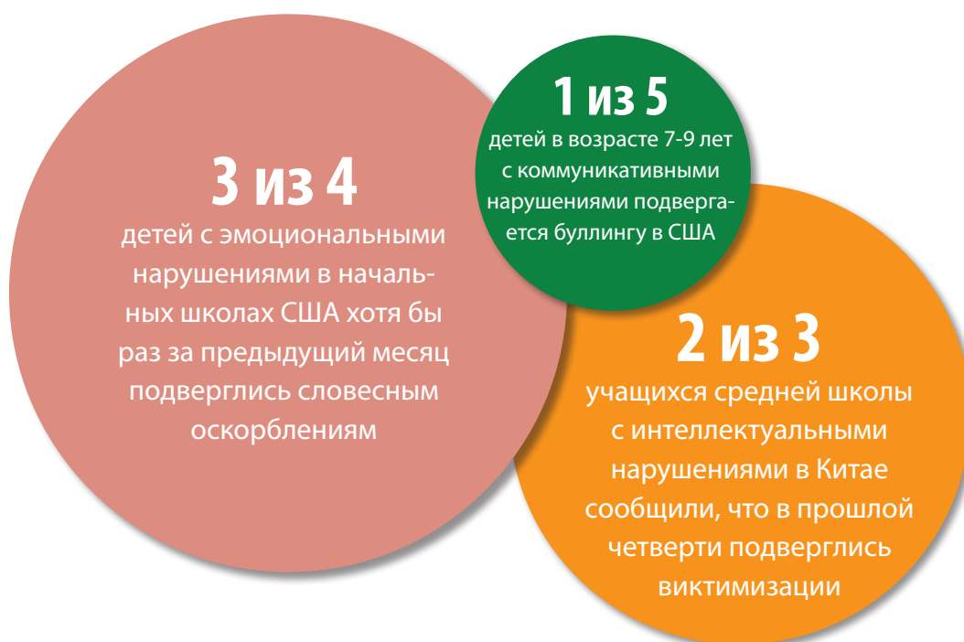
Рис. 6. У учащихся с эмоциональными, интеллектуальными и коммуникативными нарушениями выше риск насилия и буллинга

Источник данных: Bear et al (2015); Chiu et al (2017).