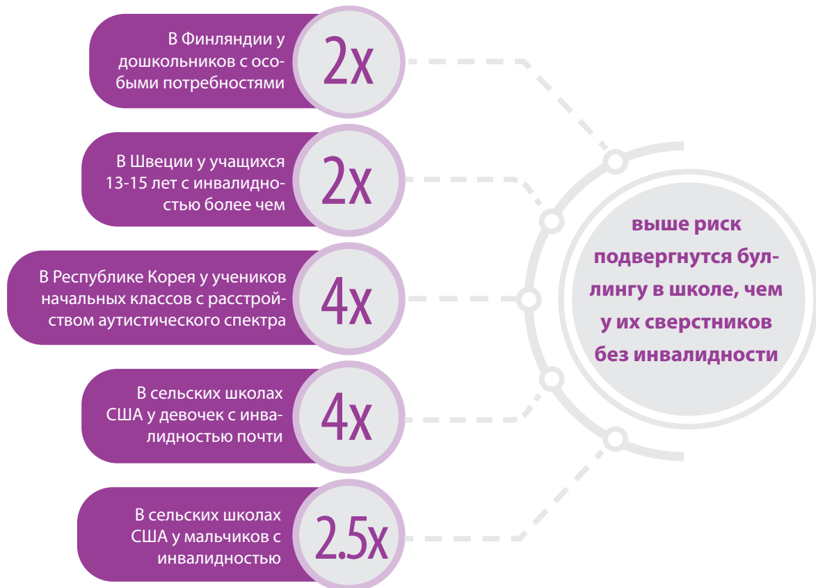
Рис 3. Учащиеся с инвалидностью чаще подвергаются буллингу в школе, чем их сверстники без инвалидности

Источники данных: Repo & Sajaniemi (2014) 14 ; Hwang et al (2018) 15 ; Farmer et al (2017); Annerback et al (2014).