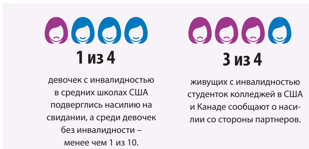
Рис 7. Девочки с инвалидностью и сексуальное насилие

Источник данных: Mitra et al (2013); Son et al (2020) 49 .