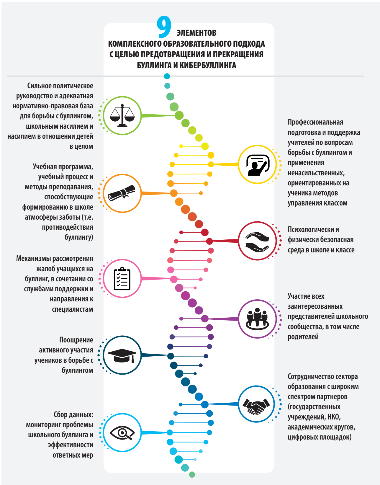
Рис 8. Элементы комплексного образовательного подхода с целью предотвращения и прекращения буллинга и кибербуллинга