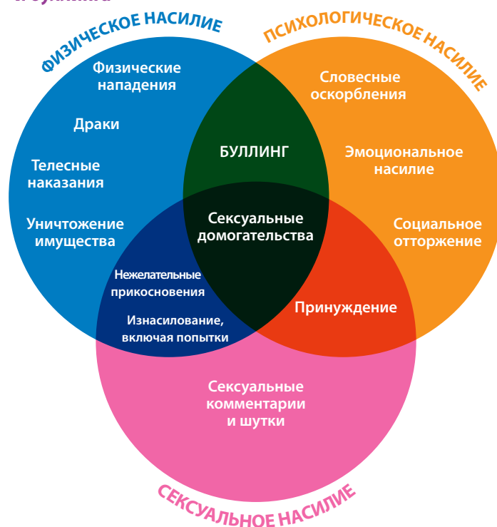
Рис. 1. Концептуальная схема школьного насилия и буллинга

Чаще всего такие действия совершают учащиеся, но иногда – учителя и другие школьные работники. Школьное насилие и буллинг встречаются во всех странах, затрагивают значительное количество детей и молодежи, наносят вред здоровью и благополучию и мешают полноценной учебе. При этом мы очень мало знаем о масштабах и характере насилия и буллинга, которым подвергаются в образовательных учреждениях дети и молодежь с инвалидностью, поскольку в ходе общих опросов не ведется сбор дезагрегированных данных об этих учащихся.