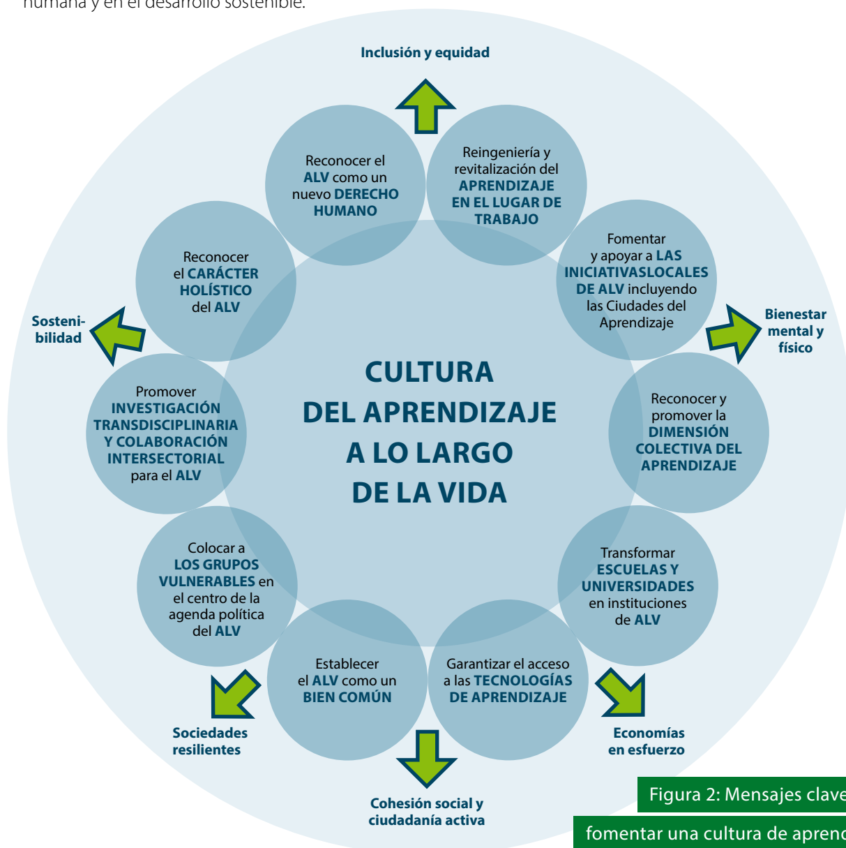
Figura 2: Mensajes clave para fomentar una cultura de aprendizaje a lo largo de la vida

Esta sección presenta 10 mensajes clave basados en la visión presentada anteriormente, sus efectos positivos y las condiciones propicias para el aprendizaje a lo largo de la vida. Estos mensajes pretenden revisar el conocimiento y repensar los propósitos de la educación y la organización del aprendizaje. También contienen recomendaciones para la adopción de acciones concretas, como la traducción de ideas visionarias en políticas, agendas de investigación y proyectos. La Figura 2 ofrece una visión general de los mensajes clave para fomentar la cultura del aprendizaje a lo largo de la vida prevista, indica sus efectos positivos esperados en las diferentes dimensiones de la vida humana y en el desarrollo sostenible.