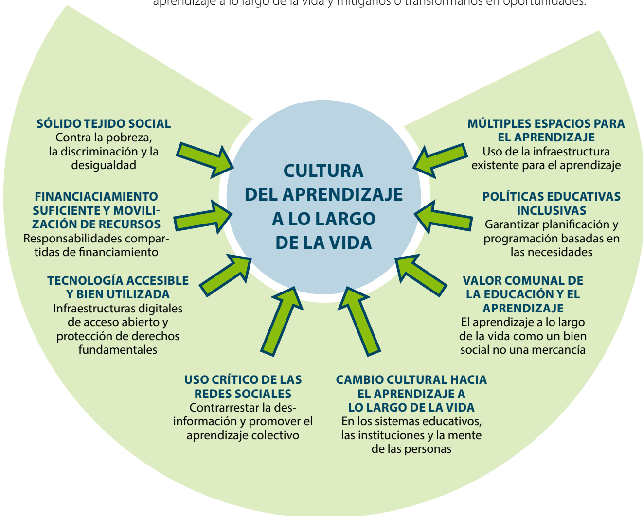
Figura 1 : Entorno propicio para alcanzar la visión del aprendizaje a lo largo de la vida en 2050.

Realizar la visión expresada a través del proceso de consulta requiere un entorno propicio para el aprendizaje a lo largo de la vida. Esto significa abordar una serie de cuestiones, identificar las circunstancias y los desafíos que actualmente inhiben el aprendizaje a lo largo de la vida y mitigarlos o transformarlos en oportunidades.