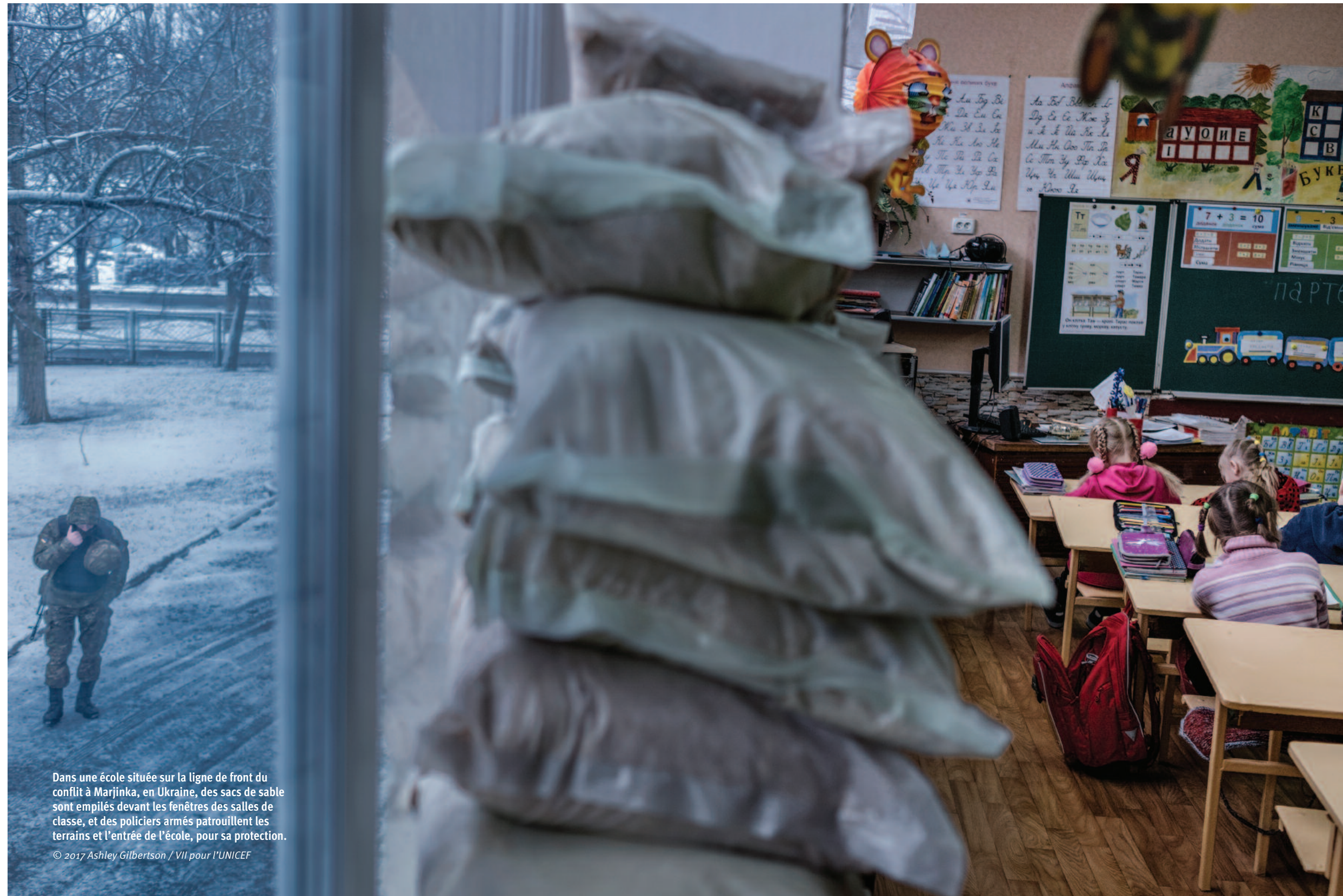
Dans une école située sur la ligne de front du conflit à Marjinka, en Ukraine, des sacs de sable sont empilés devant les fenêtres des salles de classe, et des policiers armés patrouillent les terrains et l'entrée de l'école, pour sa protection.

La présente édition de L'éducation prise pour cible , la quatrième d'une série, examine l'utilisation de la force sous forme de menace ou réelle contre les élèves, les enseignants, le personnel de l'éducation, ou des installations et du matériel éducatif. Le rapport, qui retrace les attaques contre l'éducation et l'utilisation militaire des écoles et universités à travers le monde, montre qu'entre 2013 et 2017, les attaques contre l'éducation et l'utilisation militaire des écoles et des universités ont tué ou blessé des milliers d'élèves et d'éducateurs, et ont endommagé ou détruit des centaines d'écoles et d'établissements d'enseignement supérieur.