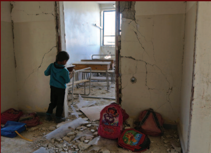
( en couverture ) Un enfant syrien regarde dans une salle de classe dévastée lors d'une frappe aérienne signalée le 7 mars 2017, dans la ville d'Utaya, tenue par l'opposition, près de la ville de Damas.