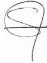
Silvia Montoya Directora Instituto de Estadística de la UNESCO

Tal como muestra el Compendio, los datos sobre los resultados del aprendizaje son una necesidad para todos los países, no un lujo. En promedio, los países de ingresos bajos y medios necesitan alrededor de 60 millones de dólares estadounidenses al año para evaluar regularmente el aprendizaje. En realidad, estos costos son inversiones que producirán beneficios exponenciales para las generaciones actual y las venideras.