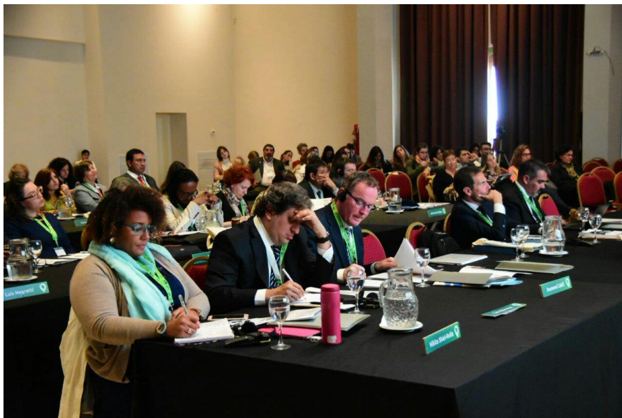
© Instituto de la UNESCO para el Aprendizaje a lo Largo de Toda la Vida (IUAL)