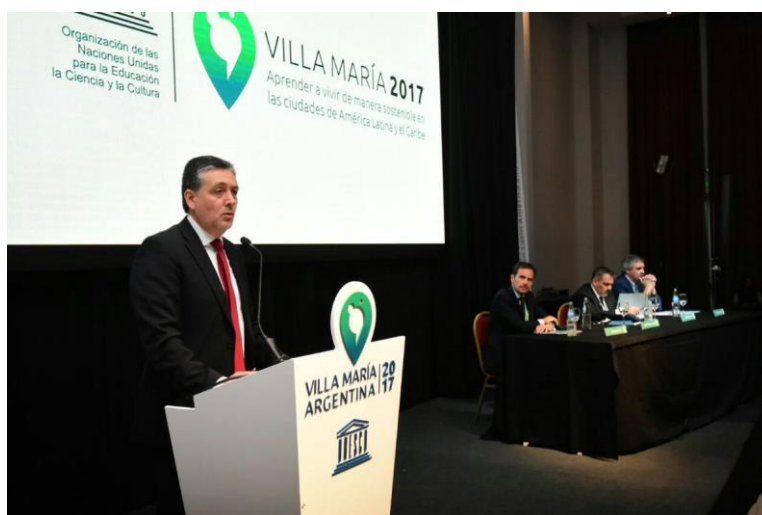
© Instituto de la UNESCO para el Aprendizaje a lo Largo de Toda la Vida (IUAL)

El Sr. Lee expuso el concepto de ciudad del aprendizaje mediante una presentación en video. Uno de los objetivos principales de la Red Mundial de Ciudades del Aprendizaje de la UNESCO, explicó, era fomentar el desarrollo de las ciudades del aprendizaje permitiendo a los miembros intercambiar información y mejores prácticas. El Sr. Lee alentó a los participantes en la reunión a sumarse a la Red, que ya contaba con más de 200 miembros. También presentó el Premio de la UNESCO para la Ciudad del Aprendizaje, cuyo fin era promover y reconocer los avances de los miembros de la Red Mundial de Ciudades del Aprendizaje de la UNESCO. Villa María ha sido una de las 16 galardonadas con el Premio de la UNESCO para la Ciudad del Aprendizaje este año.