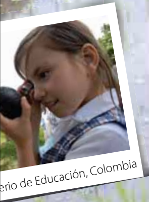
Ministerio de Educación, Colombia

Расположенный на территории биосферного заповедника Сьерра-Горда Центр Земли Сьерра-Горда им. Роберто Руиса Обрегона предлагает учебные курсы и семинары для тех, чья профессиональная деятельность связана с природными заповедниками. Его учебный курс он-лайн с последующей выдачей диплома представляет собой адаптацию к местным проблемам программы ЮНЕСКО «Преподавание и обучение в интересах устойчивого будущего».